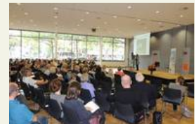
Autorentagung - Haus der Region Hannover 2014