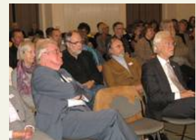
Autorentagung im Neuen Rathaus Hannover 2008