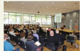
Autorentagung - Haus der Region Hannover 2014